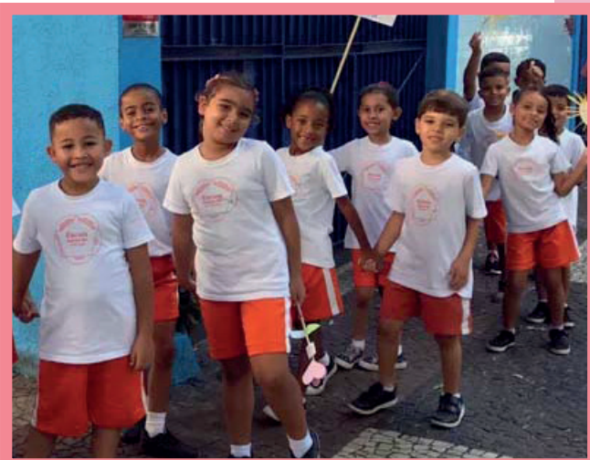
No dia 23 de abril de 2023, crianças da Escola Sathya Sai de Vila Isabel, no Rio de Janeiro, Brasil, animaram os espectadores durante uma emocionante Caminhada pelos Valores em seu bairro!