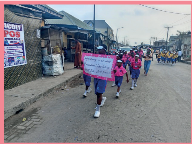
No dia 12 de fevereiro de 2024, crianças da Escola Sathya Sai de Lagos, Nigéria, caminharam pelas suas aldeias carregando cartazes coloridos e cantando canções de valores.