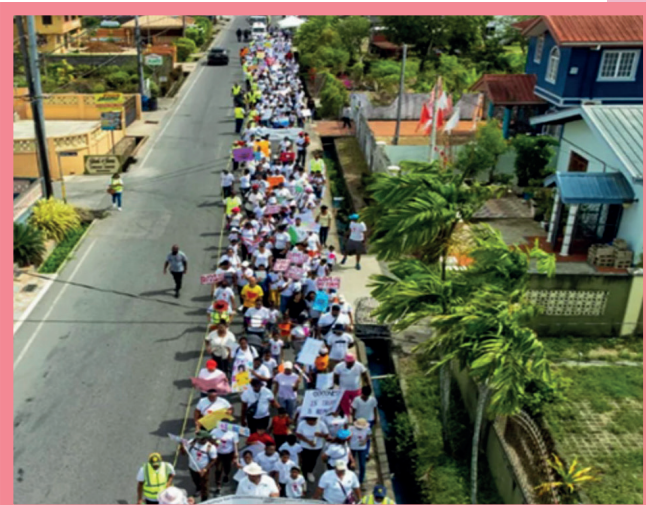
Em 6 de maio de 2023, cinco Escolas Sathya Sai em Trinidad e Tobago organizaram sua primeira Caminhada pelos Valores e Feira Ambiental. O tema do evento, que contou com a participação de mais de 350 pessoas, foi "Construindo Comunidades de Caráter, um Passo de Cada Vez".