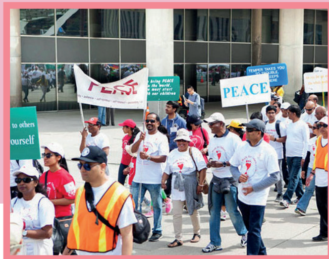
No dia 24 de abril de 2024, como todos os anos, os alunos da Escola Sathya Sai de Toronto, Canadá, caminharam pelos Valores. Antes do evento, eles fizeram uma autoavaliação para determinar o valor que precisavam praticar para seu crescimento pessoal e se comprometeram a fazê-lo durante o ano.

Você pode descobrir mais em: https://walkforvalues.com